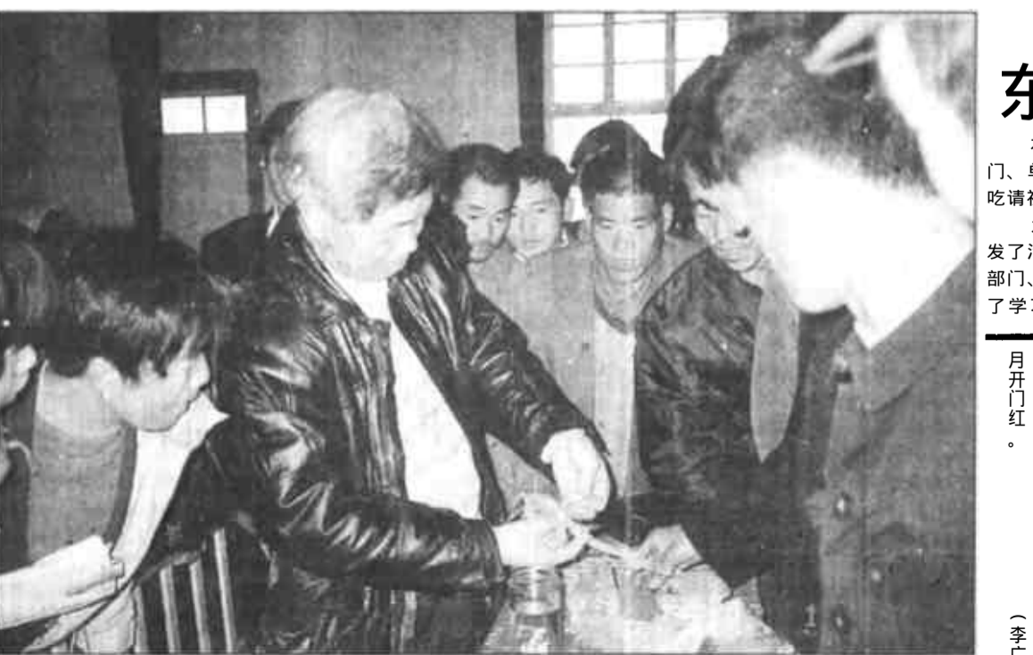
日前，广饶县李鹤乡专门聘请滨州农校教授、著名蔬菜专家纪平来该乡为农民传授蔬菜科技种植知识，2000余名农民接受了指导和培训。

该镇组建了以党员干部为主体的领导干部包片、脱产干部包村等队伍，使全镇从事思想政治工作的骨干人员达到了1300多人。去年5月份，镇领导得知西隅村对走路难问题群众反映强烈，千方百计协调资金，帮助这个村新修了三条进村柏油路，用实际行动做好了广大群众的思想政治工作。 抓阵地建设，为思想政治工作创造良好条件。该镇本着立足实际，注重实